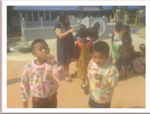
ทดลองเป่าฟองสบู่